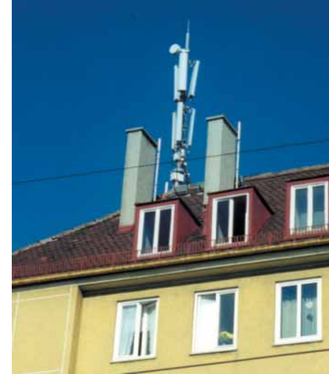
Die Mobilfunkanlage auf dem Dach kann den Wert eines Gebäudes mindern.