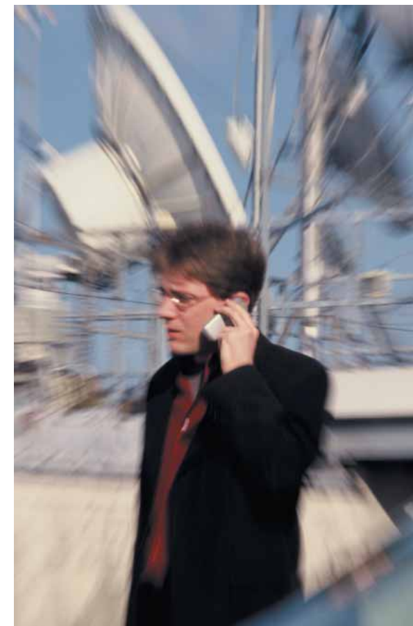
Schwindel, Unwohlsein und Nervosität wurden als Folge von Mobilfunkstrahlung beobachtet. Auch ein erhöhtes Krebsrisiko und andere schwere Erkrankungen können nicht ausgeschlossen werden.

und Japan laufenden Studien zur Überprüfung der holländischen Studie einen wirklichen Fortschritt in der Risikobewertung bringen. Wir